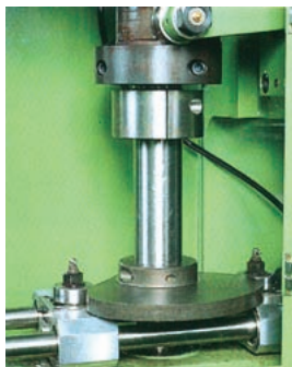
トランスファー機構

トランスファースライドは、プレス の左側のシャフトに取り付けられた カムによって、確実に作動します。